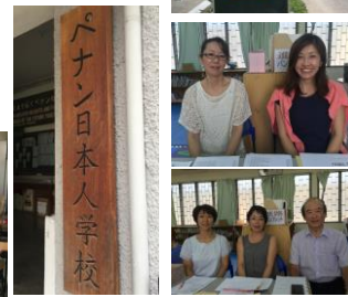
ペナン日本人学校 http://www.mypjs.com/index.html