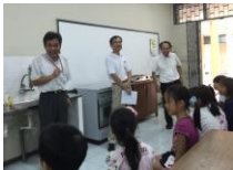
浦江校長先生、石橋教頭先生立会いで行われた歯科健診