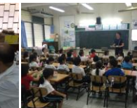
松井先生の歯みがき教室