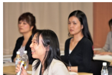
楽しいセミナー、を目指していますが質問者の表情にも笑顔が見られました

A: いや、私のボランティアで行っている中国衛生部(日本でいう厚労省)の医療情報の翻訳したものを発信する際に、カバーレターの部分に東京で開催したことについて書いていたら、何人かの人から「それ、大阪でもやってくれますよね？」というお返事が来てしまして、講師の先生にご都合をお伺いしたら、2 カ月の予約が入るので、それ以上先の日程であれば協力して戴けそうだったので、是非大阪会場での開催にこぎつけたいと思っています。9 月頃になろうかと思われま。『東京で開催したものを地域