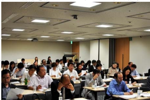
空調は効いていても熱気にあふれた会場でした。

A: 一般参加者が 42 名に四者共同開催の関係上、スタッフが 8 名で総勢 50 名分の座席が満席という感じになりました。といいまして JOMF のセミナーでは、毎回三名がけのテーブルに 2 名でお座り戴き、ゆったりとした感じで受講戴けるようにだけはしておりますが。。。今回は、会場での資料に加えて、お持ち帰り用の資料(後援企業の PR 用のものや、筆記具や用箋等も含めて)が多くあった関係上、受講時に使用するものは自分の前に、それ以外の資料については席間の空席部分において戴けて、ちょうどよい感じでした。ぎゅうぎゅう詰めレイアウトですと、そういう資料や自分の鞆等を置くところがなくなってしまい、『参加して為になり、参加して楽しい』の楽しいが不快なセミナーに変わってしまうところでした。また、通常 36 名以下での開催にしている理由の一つには、学校の教室や大学のゼミの様に講師と聴講者の距離感を縮めたいという思いがあり、結果として今回の Q&A 等でも活発な意見や質問が出る等、彼