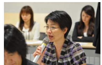
熱心に質問が繰り返される会場風景

会場の事前確認、その直後のラップアップミーティング、当日の直前打合せを入れると都合7回集まったことになります。3月25日に初回ミーティングをして当日の6月3日までの2カ月強の間にはGW休みもはありますので、かなり開催したような気持ちになります。余談ですが、4月11日と5月20日には基金で会議をしている際に強い余震に見舞われたりしたので、「このメンバーが集まると地震が来るのでは？」等と話合っていました。当日何事もなく過ぎてホッとしています。